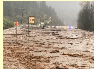
カナダ西部 土石流に埋もれた幹線道路

2021年11月にカナダ西部とアメリカワシントン州で起きた集中豪雨と大規模洪水の影響で鉄道や高速道路は機能不全に陥り、カナダ最大の港・バンクーバー港を発着する鉄道の貨物輸送が全面停止。（マクドナルドのポテトが一時Sサイズのみになったのもこれが一因だとか……）